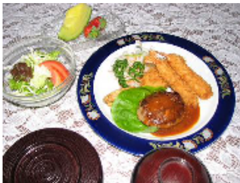
ハンバーグセット