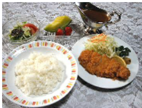
カツカレーセット